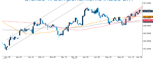
Gráfico 1. Comportamiento Índice DXY

El par EUR/USD tuvo un comportamiento bajista durante la semana, oscilando entre $US 1.067 y $US 1.075 con un valor promedio de $US 1.071. Tras los resultados de las elecciones al parlamento europeo, el presidente Macron de Francia, anunció que se realizarían elecciones para el parlamento francés este fin de semana, lo que ha generado presiones sobre el euro ante la incertidumbre política. De otro lado, Schnabel, miembro del Banco Central Europeo (BCE), afirmó que la hoja de ruta de política monetaria del BCE puede no distar mucho de la de la Fed, dejando en duda si los miembros del BCE reducirían su expectativa en el número de recortes en el año.