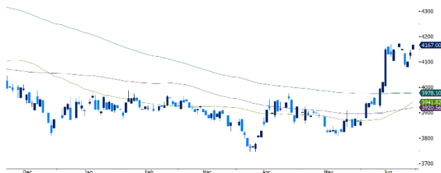
Gráfico 3. Comportamiento USDCOP

El par USD/COP tuvo un comportamiento lateral durante la semana, luego de la corrección a la baja que tuvo posterior a la publicación del Marco Fiscal de Mediano Plazo tras haber alcanzado el máximo del año ($4.215). El par operó en el rango entre $4.060,60 y $4.183, con un valor promedio de $4.129,10 y una volatilidad inferior a la presentada durante el mes. Mañana (28 de junio) habrá decisión de política monetaria, en donde se espera que haya un recorte de 50pbs en la tasa de interés que, de materializarse, el USD/COP podría mantenerse en los niveles actuales, no obstante, de darse un recorte menor dada la persistencia de la inflación, podría operar a la baja por lo que consideramos niveles a monitorear de $4.110 y $4.020, sin embargo, si el peso opera nuevamente al alza, las resistencias a monitorear serían el $4.200 y el $4.215.