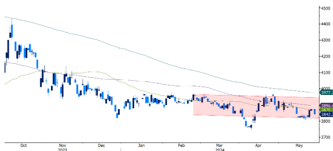
Gráfico 3. Comportamiento USDCOP

El par USDCOP tuvo un comportamiento bajista durante el mes, operó en el rango entre $3.807,36 y $3.951,20 con un valor promedio de $3.867,29. El peso se vio favorecido por la relativa tranquilidad en los mercados internacionales, lo cual generó que el comportamiento de la moneda fuera estable y con baja volatilidad a lo largo del mes. El par podría mantenerse operando en el rango entre $3.840 y $3.900, luego, de operar por debajo del nivel de $3.840, podría ir a buscar los niveles de $3.820 y el nivel psicológico de $3.800; sin embargo, si opera al alza y rompe el nivel psicológico de $3.900, podría buscar el nivel técnico de $3.920.