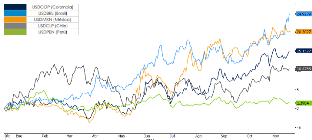
Gráfico 2. Devaluación año Corrido Monedas LATAM

Durante noviembre, las monedas de la región se depreciaron ante la dinámica del dólar a nivel internacional. Este comportamiento estuvo liderado por el real brasileño (-3,07%), peso argentino (-2,00%), el peso mexicano (-1,66%), el peso chileno (-1,17%) y el peso colombiano (-0,21%), mientras que el sol peruano se valorizó 0,39%. Adicional a la fortaleza internacional del dólar, las preocupaciones acerca del tema fiscal en Brasil han generado que el real se deprecie significativamente, el USD/BRL llegó a máximos históricos, lo que ha tenido un efecto contagio sobre los pares en la región.