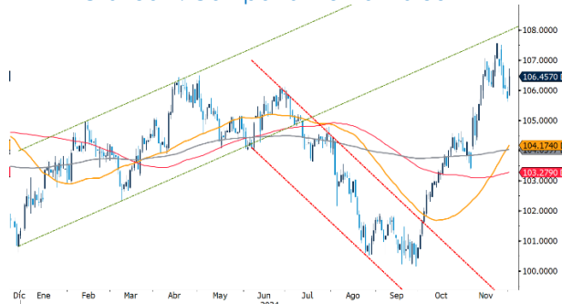
Gráfico 1. Comportamiento Índice DXY

Ante el resultado de las elecciones, el par EUR/USD operó a la baja y alcanzó el mínimo del año $US 1.0335, durante el mes acumuló una depreciación del 3,03%. Las razones detrás del movimiento fueron: las expectativas de una política comercial más restrictiva con Estados Unidos, el escalamiento del conflicto entre Rusia y Ucrania y las preocupaciones por una desaceleración en el crecimiento económico de la Zona Euro ante datos económicos débiles para el bloque y sus principales economías.